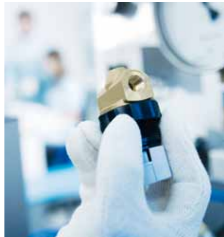
Qualitätsmanagement: mit Fingerspitzengefühl.