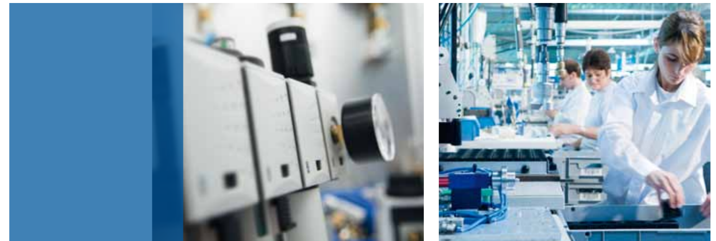
Innovativ, kompakt, modular: die Futura-Serie.