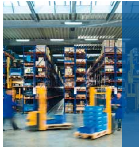
Unser Lager: ausgerichtet auf schnellste Lieferung.