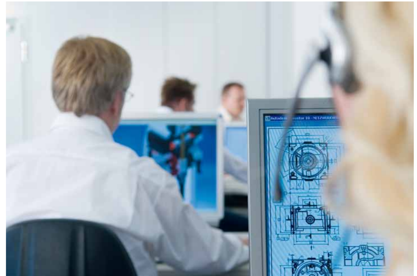
Konstruktionsabteilung: immer auf dem neuesten technischen Stand.